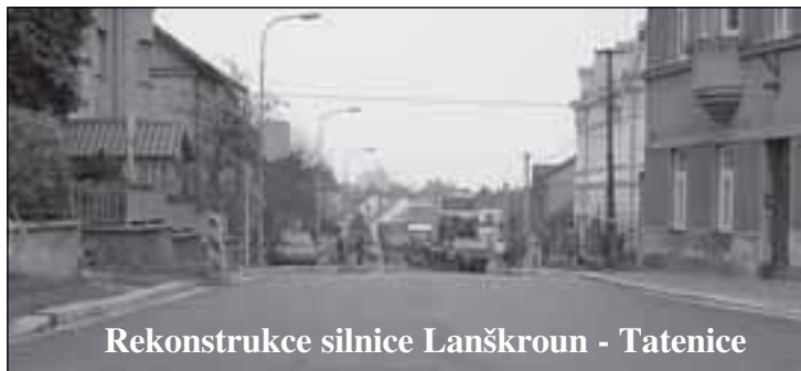
Rekonstrukce silnice Lanškroun - Tatenice

Z regionálního operačního programu regionu soudržnosti Severovýchod je financována modernizace silnice mezi Lanškrounem a Tatenicí, jejímž investorem je Pardubický kraj. Úsek dlouhý necelých 10 km má být opraven v průběhu dvou let s ukončením v říjnu 2010. Začalo se u lanškrounské Krčmy.