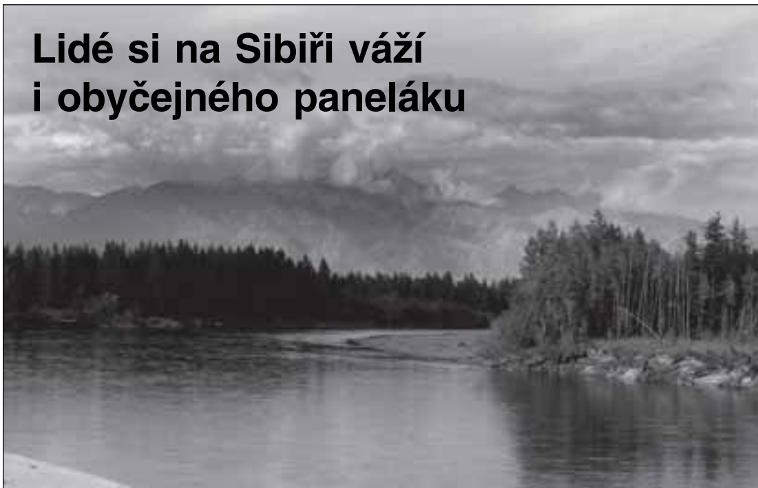
Řeka Čara, v pozadí se táhne pohoří Kodar

Já jsem letos byl kupříkladu ve městě Severobajkalsk, což je město na Bajkalsko-amurské magistrále postavené přímo na břehu Bajkalu, a navštívili jsme místní železniční muzeum. Ruská průvodkyně byla při svém vyprávění tak neuvěřitelně zanícená až vášnivá, že když jsem si na konci prohlídky koupil poslední výtisk knížky o téhle stavbě, tak se dojetím rozbrečela. Jakýsi ruský mluvící návštěvník se chtěl v průběhu jejího výkladu na něco zeptat a přerušil ji dotazem, za což dostal vyhubováno, neboť paní nechápala, jak si může dovolit rušit výklad pro cizince!