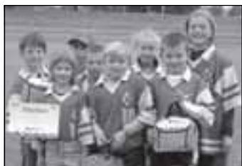
Smetanka na Kinderiádě Str. 19

Aktuality z Lanškrounska: http://aktualne.mesto-lanskroun.cz/