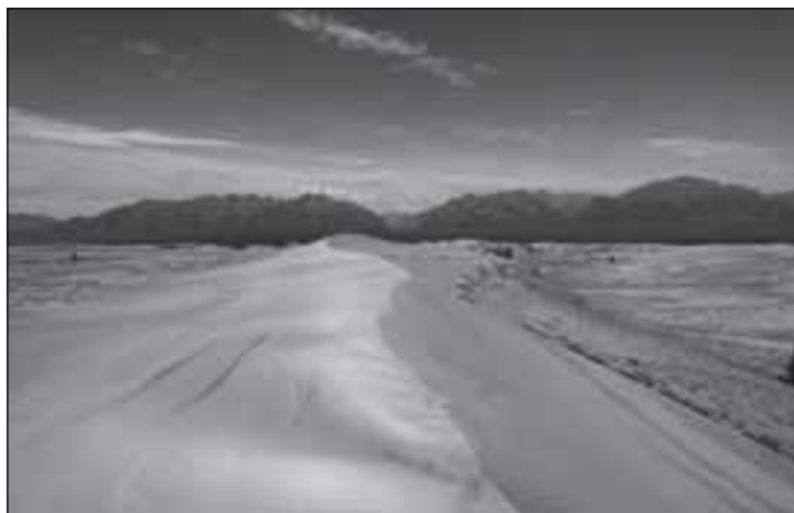
Písečné duny v oblasti Čarských písků