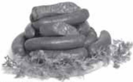
JELÍTKA KROUPOVÁ 100g 6Kč

Složení výrobku: vepřové maso 60% vepřová krev 30% kroupy 10% sůl jedlá přírodní koření