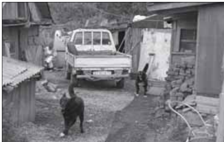
Lidské obydlí na ostrově Sachalin