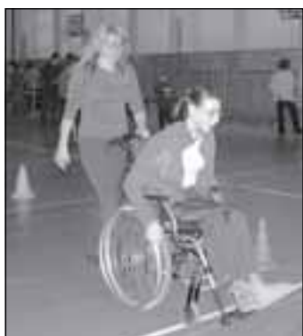
Sportovní hry 2008 - str. 8