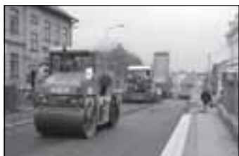
Rekonstrukce silnice do Tatenice zahájena - str. 5