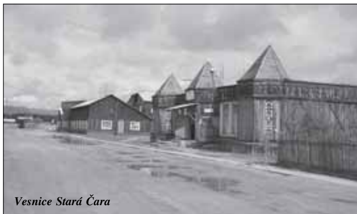
Vesnice Stará Čara