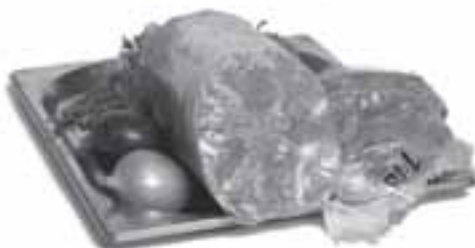
TLAČENKA SVĚTLÁ 100g 7,70Kč

Složení výrobku: vepřové maso 60% vepřová krev 30% kroupy 10% sůl jedlá přírodní koření